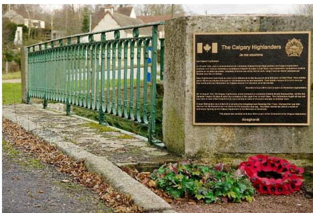
De brug in Claire Tisson over de Laize.

Clair-Tison is een dorp met wat stenen boerderijen, gelegen in een vallei. Na een dag lopen, het is zeer warm, gaan de Highlanders de nacht in zonder slaap. Om 01:45 uur, het is een donkere, mistige nacht, wordt de aanval ingezet. Allereerst wordt Le Mesnil ingenomen, een dorp ten noorden van Clair-Tison. Op 13 augustus, om 14.00 uur, wordt de aanval op Clair-Tison ingezet. De Canadezen worden hevig onder vuur genomen door Duitse legereenheden, maar in de avond wordt ook hier een brug over de Laize ingenomen.